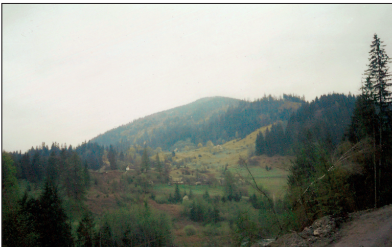
Bieszczady widok z drogi Arłamów - Kwaszenina

się kiedyś wieś Arłamów. Nazwa ta na stałe przyłgnęła do ośrodka. Pułkownik przez długi czas nie narzekał na brak zajęć, przygotował bowiem logistycznie budowę, a jednocześnie kierował ośrodkiem w Łańsku. W końcu musiał się jednak skupić na Arłamowie. Powierzchnia całego terenu wypoczynkowo-łowieckiego była ogromna. Obejmowała tereny wsi: Grąziowa, Kwaszenina, Trójca, Borysławka, Jamna Górna i Dolna, Krajno, Łomna i rezerwat Tarnica. Łącznie z przyległościami było to niespełna 25 tysięcy hektarów. Cały teren ogrodzono trzymetrowym płotem o długości ponad 80 km. Wykonano w nim przejścia dla zwierzyny w taki sposób, że mogły wejść do środka ale wydostać już się nie mogły. Drogi dojazdowe zostały zamknięte. Przy szlabanach stali wartownicy, a teren był patrolowany. Z myślą o łatwiejszym docieraniu do ośrodka niedaleko Birczy zbudowano lotnisko. Na kompleks składały się: