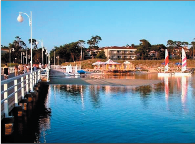
Jurata – widok z mola na brzeg Mierzei Helskiej

to tylko w lipcu i sierpniu, a w pozostałych miesiącach ośrodek świecił pustkami. Odwiedzający korzystali z plaży i kąpeli, a ich bezpieczeństwa strzegli żołnierze-ratownicy. Cały teren był oczywiście chroniony. Kierował nim rodowity Kaszub, który po każdym wypowiedzianym zdaniu dodawał słowo „jo”. Nie był przesadnie wymagający. Gdy nie było gości żołnierze mogli korzystać z plaży, ale obowiązywał kategoryczny zakaz wchodzenia do wody. Kadra była bardzo wyczulona na punkcie zapobiegania wypadkom utonięć żołnierzy. Ci ostatni podpisywali rozkaz o zakazie kąpieli.