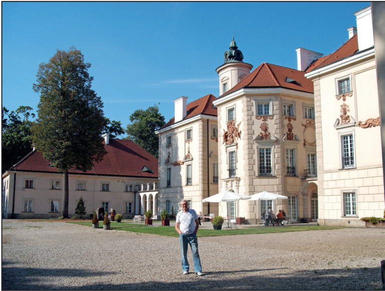
Pałac Jezierskich w Otwocku Wielkim