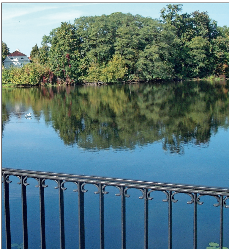
Widok na jezioro Rokola

Jezierskich. Po II Wojnie Światowej przejęły je z kolei władze PRL. W latach 1947 – 1958 trwał remont pałacu. Po remoncie, do lat 70-tych był w nim dom poprawczy dla dziewcząt. Z tego okresu w pomieszczeniu przeznaczonym na wartownię pozostały, nie usunięte nie wiadomo dlaczego, pamiątki dziewcząt. Żołnierze zaczytywali się w nich. W latach 80-tych pałac najpierw przejęła Kancelaria Prezydenta, a potem MSW.