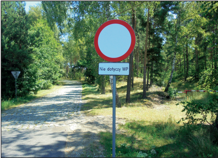
Zjazd z drogi w kierunku ośrodka prezydenckiego

włodarze przyjeżdżali rzadziej, a dominowali ci, którzy byli zapalonymi grzybiarzami. Wystarczyło wyjść na godzinę do ogrodzonego lasu i wracało się z pełnymi koszykami. Korzystali z tego żołnierze załogi ochronnej pełniący tu półroczną służbę od kwietnia do października. Ich służbowy jadłospis codziennie był wzbogacany przede wszystkim podgrzybkami.