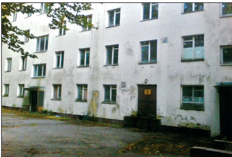
Łańsk - były hotel