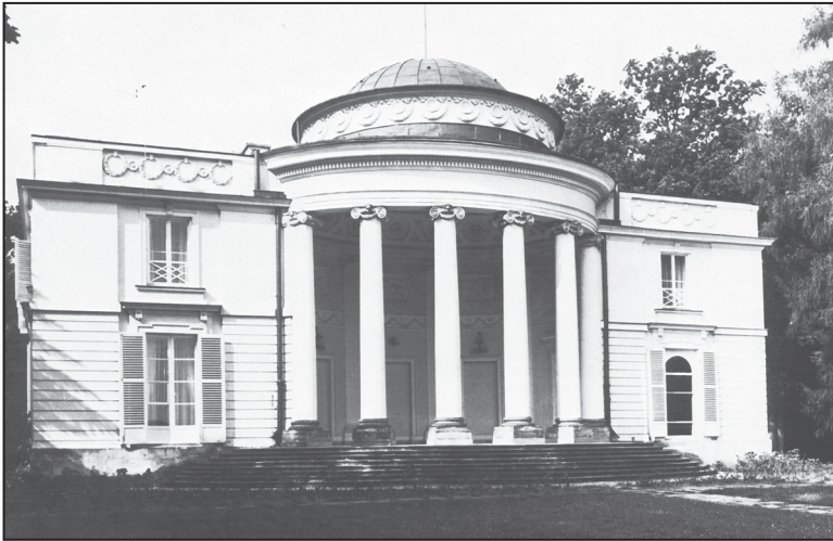
Natolin – pałac Potockich

i sarkofagiem córki Potockich – Natalii Sanguszkowej, od której imienia wywodzi się nazwa kompleksu.