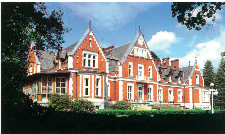
Pałac Radziwiłłów w Jadwisinie

II Wojny Światowej. W czasie wojny las stał się miejscem tymczasowych pochówków żołnierzy obu walczących stron. Po wojnie przejęło pałac i teren Ministerstwo Oświaty, a w 1960 r. przejęła go Kancelaria Prezesa RM. Od 2009 r. częściowo udostępniono go turystom, niestety od 2015 r. niszczeje.