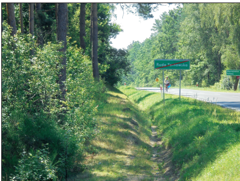
Droga Otwock-Dęblin na wysokości zjazdu do ośrodka prezydenckiego

Ośrodek, który nosi nazwę „Promnik”, jest jedynym, obok ośrodka „Mewa” nieopodal Juraty, nadal pełniącym funkcję rządowo-prezydenckiego ośrodka wypoczynkowego. Chętnie był odwiedzany przez gen. Jaruzelskiego, Wałęsę i Kwaśniewskiego. Obecnie częstymi gośćmi jest aktualna para prezydencka. Nie bywały tu rządowe delegacje z zagranicy. Ośrodek jest niedostępny i chroniony przez SOP.