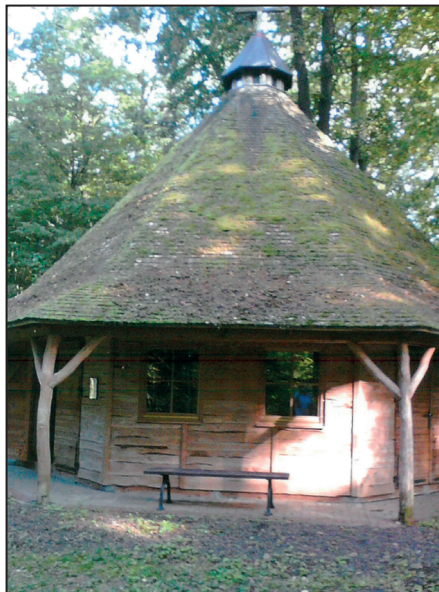
Łańsk - kaplica - wrzesień 2017 r.

Ośrodek był oczywiście chroniony. Bezpieczeństwo zapewniali żołnierze Wojsk Nadwiślańskich, którzy na co dzień stacjonowali w Warszawie. Obiekt był więc chroniony przez liczną załogę przybywającą ze stolicy. System ochrony tworzyły warty wyznaczane ze składu załogi. W czasie pobytu gości ilość posterunków zwiększano. Przeciwległy brzeg jeziora był obserwowany przez żołnierzy wyposażonych w silnie powiększające lornetki. Dowódcą warty w tym czasie był oficer, zdarzało się też, że na posterunku przy bramie głównej oprócz wartownika również był oficer.