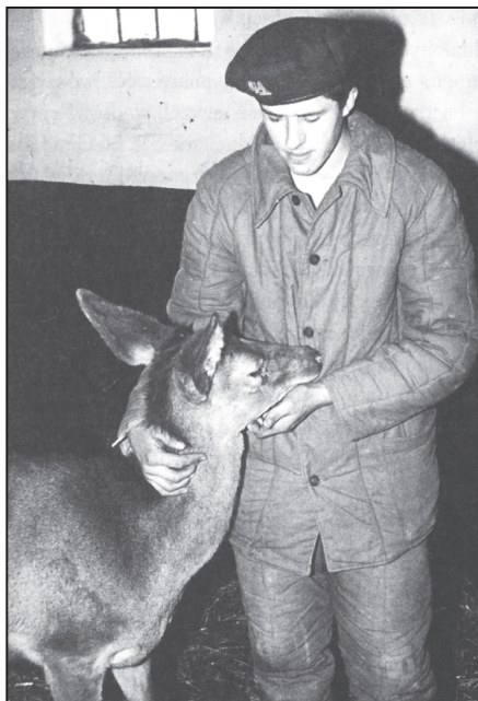
Arlamów – Żołnierz pułku ochrony z uratowaną lanią