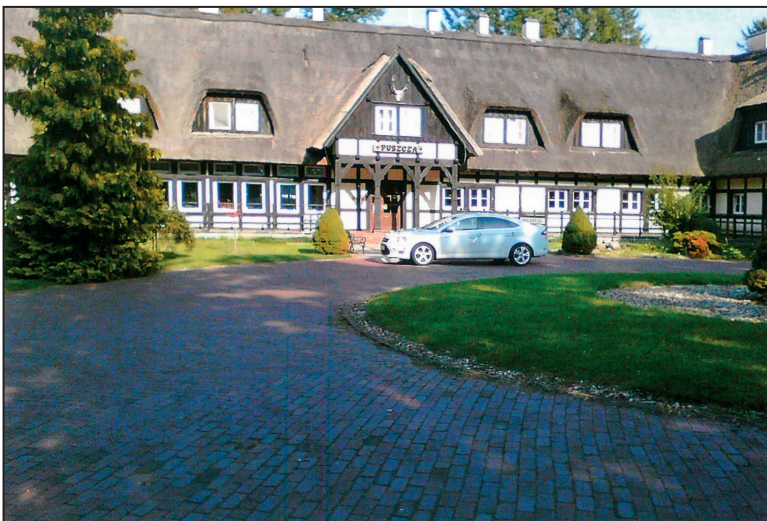
Łańsk - budynek główny - wrzesień 2017 r.

mitym stanie do naszych czasów. Już wówczas przyjeżdżał tu na polowania feldmarszałek i prezydent Niemiec Hindenburg, a później też feldmarszałek Göring.